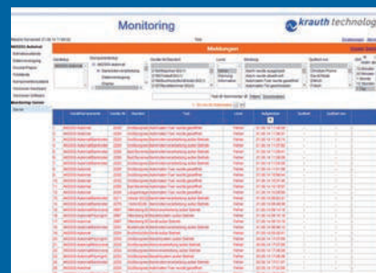
Übersicht der Meldungen

Die in dieser Unterlage erhaltenen Angaben und Daten können ohne vorherige Ankündigungen geändert werden. Die Darstellungen, Bilder und Screenshots sind Beispiele.